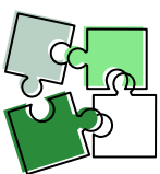
Onderwijs en Jeugdhulp SWV Utrecht PO

Het pilotjaar van de SOM HB+ groep op sbo Belle van Zuylen is gebruikt om het aanbod en de samenwerking tussen onderwijs en jeugdhulp te versterken.