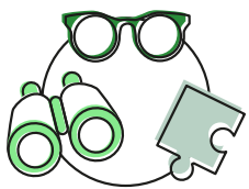
HGD-HGA SWV Utrecht PO

De werkgroep sterke basis werkte een informatieset uit met daarin de stedelijke visie op de sterke basis [waarom], de 25 afspraken voor de sterke basis [wat] en de inzet van Perspectief op School ter ondersteuning hiervan.