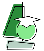
Doorgaande Lijn SWV Utrecht PO

In samenwerking met de Marnix Academie, het Instituut voor Onderwijs en Orthopedagogiek, International School Utrecht en Taalschool Utrecht ontwierpen we een curriculum voor het opleiden van Nieuwkomersspecialisten.